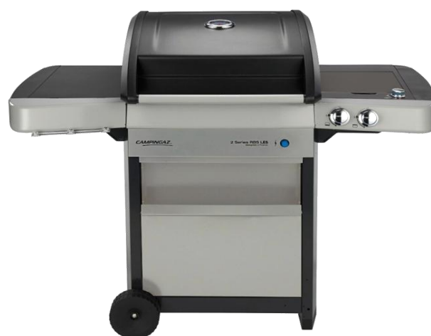
2 SERIES RBS LES