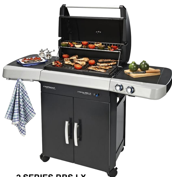
2 SERIES RBS LX