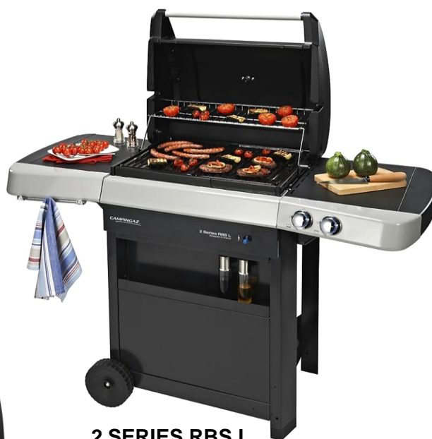
2 SERIES RBS L