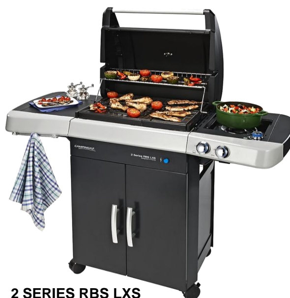
2 SERIES RBS LXS