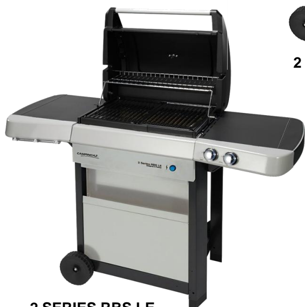
2 SERIES RBS LE